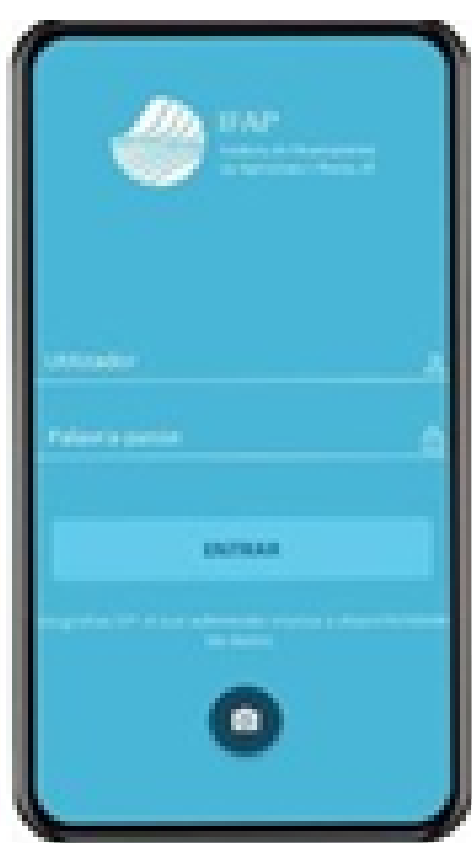
APP IFAP MOBILE