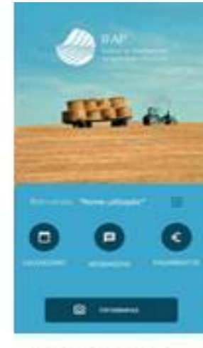
App IFAP Mobile